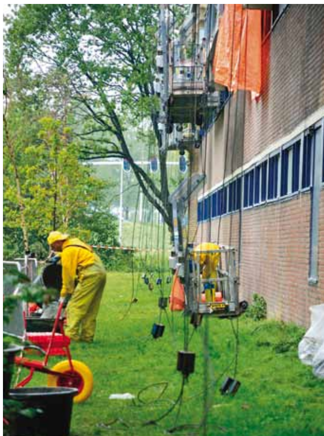
▲ Aanbrengen Kathodische bescherming